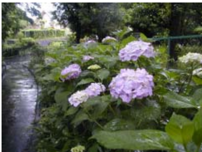
いま大勢の住民が加わって地域の美化運動が展開中だ (写真はむじなが池公園西側一方通行道路美化活動)

2 つ目は麻生のまちの課題を発見し、『裏方』として地域住民のみなさんや他の団体などとの連携を図りながら、活動を立ち上げ、軌道にのるまで協力する役割を担います。