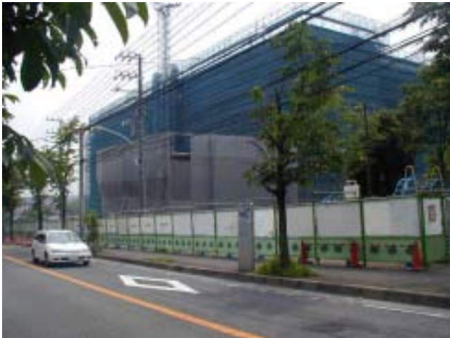
足場がとれていないので中の様子は見えませんが、内装工事も相当進んでいる... (背後は工事中の昭和音大、道路手前方向イトーヨーカドー)

完成した施設をぜひ利用したいと考えている市民も多いと思いますが、利用者として関心のある事柄について、すでに確定していることをお知らせします。